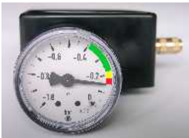
(Abb. 1) Vakubox mit Vakuumeter, Aufsicht

Die Schläuche können an der Schnellkupplung des Schlauchverbinders gekürzt werden