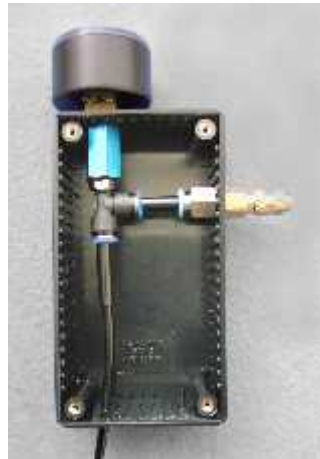
(Abb. 1) Vakubox, Innenansicht