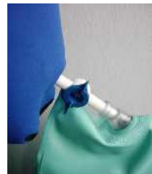
Abb. 4) Ablassen des Granulates bei geöffnetem Drehventil (blau)