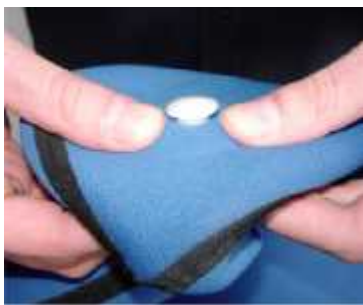
(Abb. 3) Entfernen des Umfüllstutzen